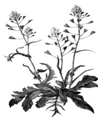
В. Пастушья сумка.